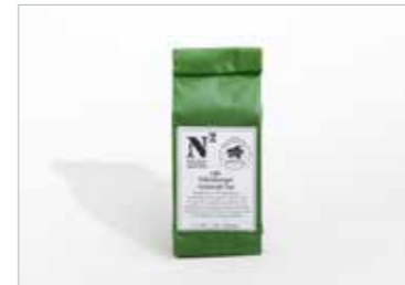
Oldenburger Grünkohl Tee