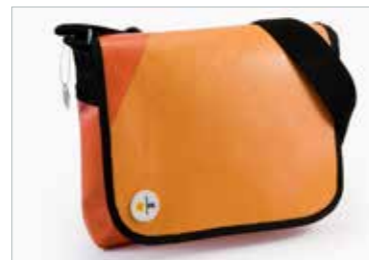
Tasche aus alten Werbebannern