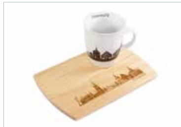
Frühstücksbrettchen und Becher

Die Souvenirs sollen Qualität und Regionalität vereinen, möglichst umweltfreundlich hergestellt sein und in der Produktion ökologische und soziale Bedürfnisse berücksichtigen.